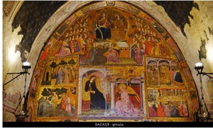
Basilika Santa Maria degli Angeli